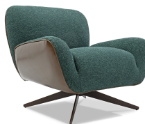
cod. 100 POLTRONA FISSA